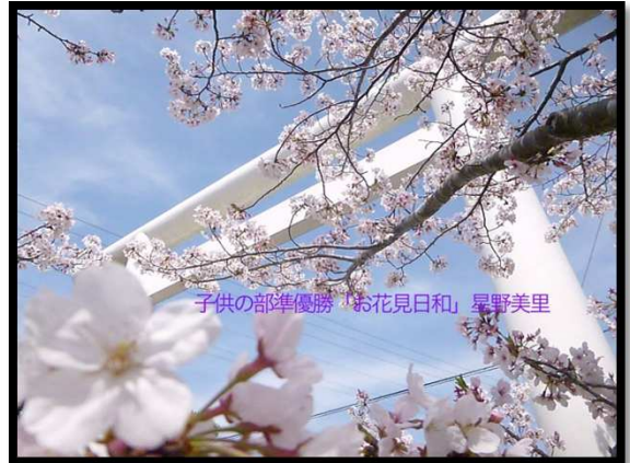
準優勝 → 「お花見日和」 6年 星野美里