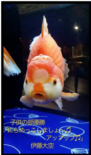
← 優勝 「にらめっこしましょ〜アップップ」 4年 伊藤大空