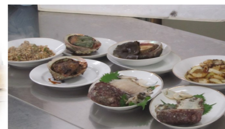
披露された様々な料理や撮影風景