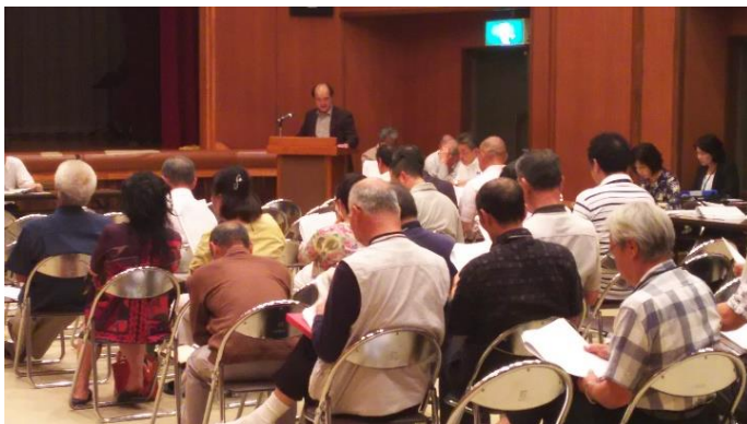
*各議案について役員から報告・説明を聞く会員