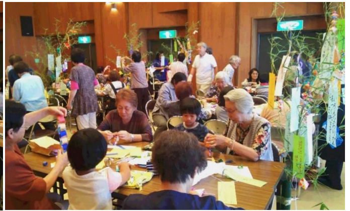
*小学生たちの元気な『よさこいソーラン』を見る高齢者の皆さん *児童と高齢者が協力して七夕の笹飾りづくり