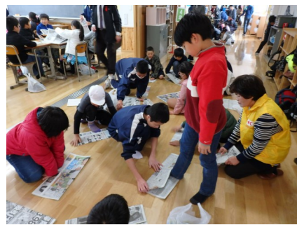
足のサイズを計って、スリッパ作り

11月28日（月）富山学園の津波避難訓練にあわせて開催しました。まず、新聞紙スリッパ作りです。日赤奉仕団とNPO法人ゆかいな仲間たち・ふらっとのメンバーがサポート役で、去年の講座で経験したことがある中学生が小学生に教えました。その後、映像を交えた講話や煙道訓練・お誕生日ゲームなどの演習を実施しました。「津波てんでんこ」という釜石の教訓のように、自分の命は自分で守るように。そして家族で避難場所を決めておくようにとお話がありました。