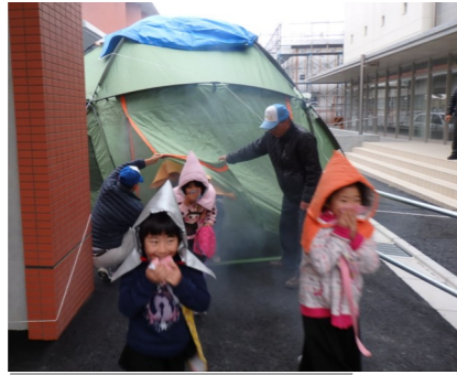
煙道訓練・姿勢を低く