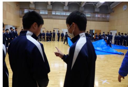
誕生日ゲーム・無言で誕生日順に並びましょう