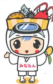
南房総市のゆるキャラ『みなたん』