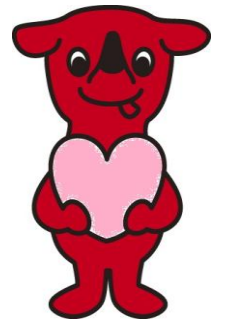
千葉県マスコットキャラクター チューパン