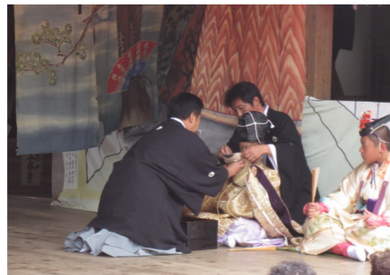
舞台上に面箱が運ばれ面が付けられる