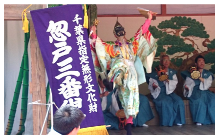
農民の象徴、三番叟の舞はしだいに躍動感あふれる舞になっていく