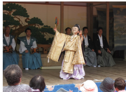
集落の長の象徴、翁(おきな)の舞