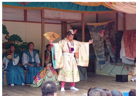
若者の象徴、千歳(せんざい)の舞

※注1 飄逸: 考え方や行動が世俗のわずらわしさにとらわれずのびのびしていること