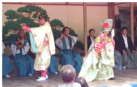
千歳が三番叟に鈴を渡し退場する