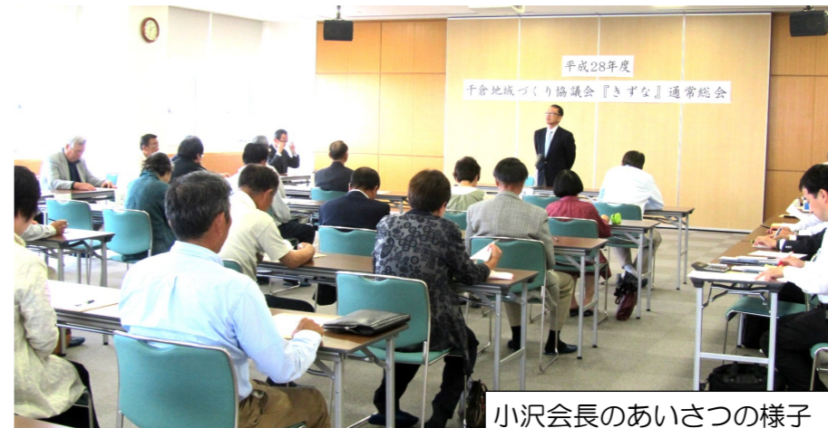
小沢会長のあいさつの様子