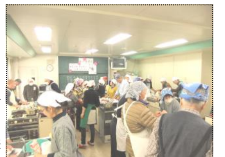
(和気あいあいと進められた男の料理教室)

8年前に奥さんを亡くされた男性は「日頃の食事は、出来合いのおかずをスーパーで購入して済ませていました。料理を作ることがこんなに大変だとは思いませんでした。今更ながら、妻に感謝しています」とのこと。皆さん交流も深めて、楽しいひと時を過ごしたようでした。