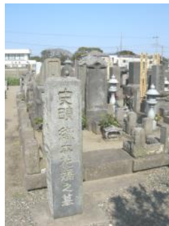
(写真:富津市富津大乘寺にある花婿の墓)

一方、小林一茶と交流のあった女流俳人の※織本花婿の句に「若草やいとしき人のむかし道」の句があります。一茶の句と合わせると別々のものではなく、相通じる一連の心情が現れているようです。一茶の句から旅姿の一茶と花婿が杖を頼りに、木の根峠に登る姿