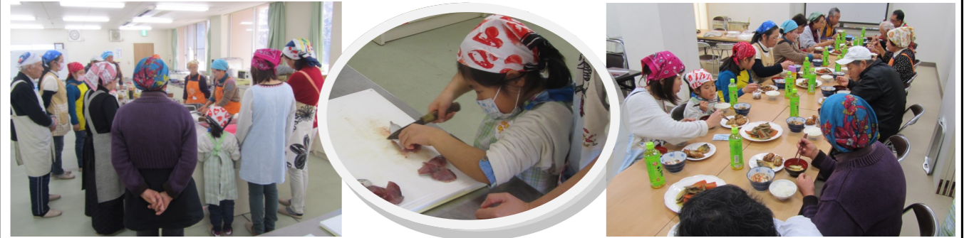
講師の説明を皆真剣に聞いています

1月24日（日）、きずなの会員を講師に子ども2名を含む15名が参加して、地元の旬の食材を使った『きずなの旬食料理教室』が行われました。メニューはサバのみそ煮、サバの南蛮漬け、サバのさつま揚げの3品。サバの捌き方、臭みの取り方などを教わり、調理後は講師の先生を囲み（先生が、さっと煮てくださった煮しめ、お汁も並び）楽しい試食会。夏休みに親子で参加くださった方が、引き続き参加くださったり、家庭でコツの生かせる料理教室は人気です。参加者からは「引き続き次回も必ず参加します！」と嬉しい声も聞かれました。今後も続けて行きますので皆様の参加お待ちしております。