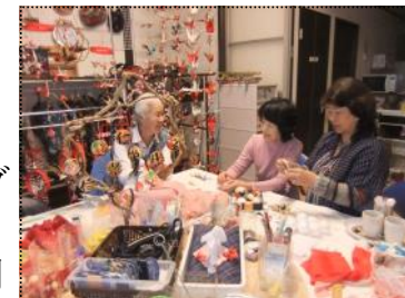
（展示に向けて、急ピッチに制作が進みます）

「吊るし雛作成グループ布遊び・笑む・笑む（m・m）の会」は古い布や帯などを加工して、吊るし雛を作成している6人のグループです。