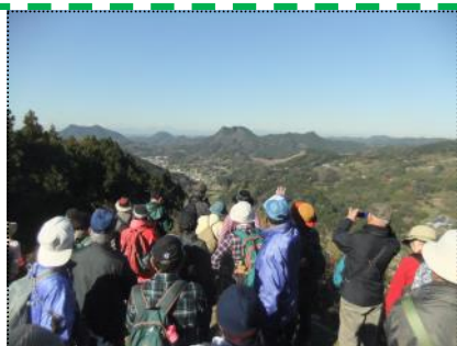
（御殿山の途中、大峰山（峰林山からの眺め）

風が少し強いぐらいで天候もよく、まずまずのウォーキング日和に恵まれた今回。午前中に御殿山を午後から用田要害山に登り、ご夫婦や友人たちと話をしながら歴史探訪を行い、それぞれのウォーキングを楽しみました。