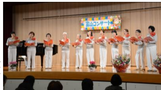
（きれいなハーモニーを聞かせてくれたベッラ・ルーナのメンバー）

合唱団大地が主催する富山コンサートが、12月6日、富山公民館で開催されました。当日は、合唱団大地外地元のベッラ・ルーナやアンサンブルWIND・ポピーコーラスの合唱や4人の独唱などが披露されました。合唱曲は「春の海」や「川の流れるように」「銀色の道」「白浜音頭」などおなじみの曲が多く、観客は、楽しそうに一緒に口ずさんでいました。