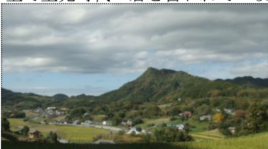
（用田要害山の中腹からの伊予ヶ岳方面の眺め）

なお、宿要害の東南、用田集落に「用田要害」と呼ばれる小高い山があります。この山も山容から見て要害山と呼ばれる資格は十分にあります。この外、市部の要害山（市部松尾神社裏山）高崎の要害山（高崎字冷水）などがありますが、いずれの山も全て里見時代の砦と言われています。