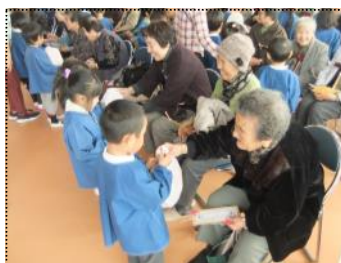
(プレゼント交換をする園児とお年寄り)

12月14日、ふれあい交流会が富山幼稚園で行われました。当日は、老人クラブやお達者クラブからのお年寄りが、園児の劇や歌を楽しみました。最後にそれぞれプレゼントの交換をして、交流を深めました。