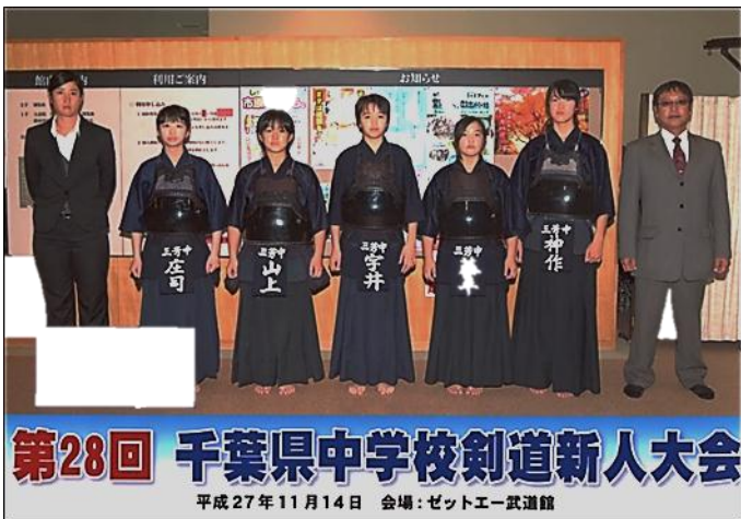
第28回 千葉県中学校剣道新人大会 平成27年11月14日 会場:ゼットエー武道館

県大会は、11月14日に市原市のゼットエー武道館で行われました。二回戦で印旛地区代表の桜大中学校と対戦し、結果は残念ながら3対0で敗退となりました。