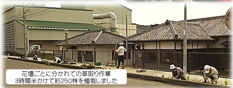
花壇ごとに分かれての草取り作業 3時間半かけて約250株を植栽しました