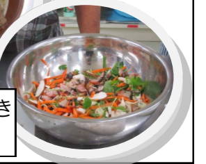
彩り鮮やかなかき揚げになります