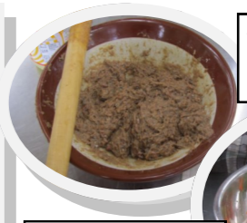
サンマのつみれもきれいにできました