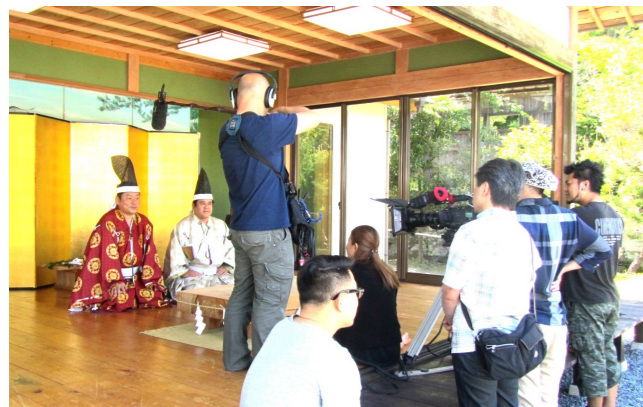
映画のインタビュー風景（昨年5月17日、春の例大祭にて）

8月には訪日外国人が前年比64%増を記録し、今世界はまさに日本ブーム。千倉地域づくり協議会『きずな』高家学ぼう会部会では、2010年の東京オリンピックに向け、日本で唯一料理の祖神を祀った高家神社をアピールしていける様、新たな展開を模索しグローバルな発展に向け活動して行きます。