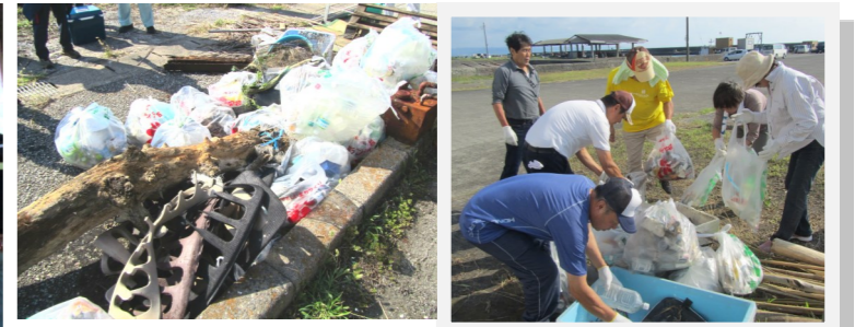
たくさんの方々の参加をいただき、流木なども集められ漁港周辺は元の美しい景観を取り戻しました。