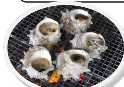
海産物が人気のバーベキューコーナー