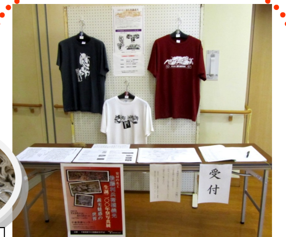
会場の様子（千倉保健センター）