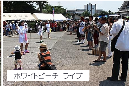
ホワイトビーチ ライブ