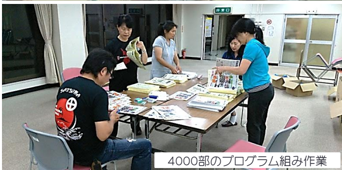
4000部のプログラム組み作業