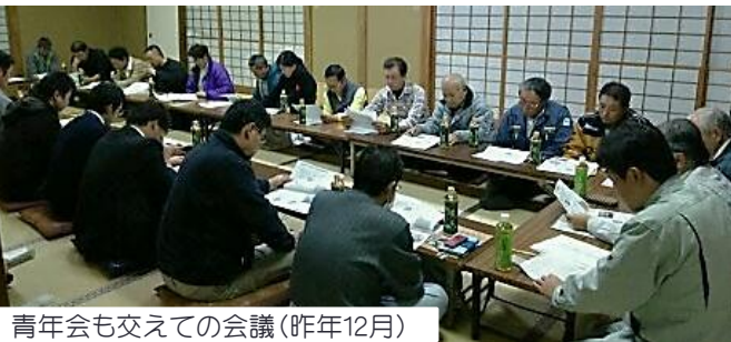
青年会も交えての会議(昨年12月)