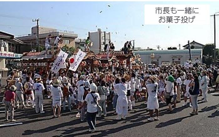
市長も一緒にお菓子投げ