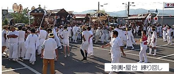
神輿・屋台 練り回し