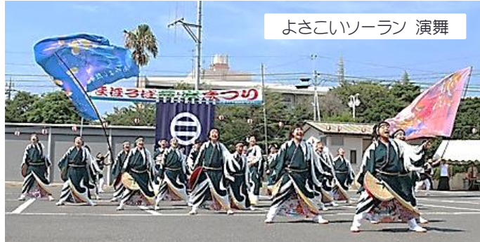
よさこいソーラン 演舞