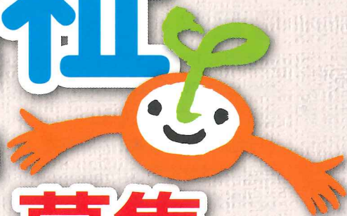
NPO法人「モンキーマジック」 (2014年受賞)