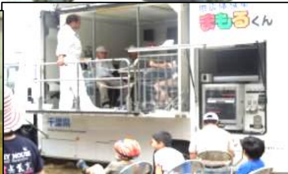
地震体験車乗車会

郷づくりまるやまの部会「セーフティー丸山」は、7月18日に地震体験車乗車会を市場の集会所の前の広場と日蓮寺駐車場で開催。近所の家族連れや日蓮寺のあじさいの手入れをしている人たちが乗車体験しました。