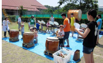
太鼓と一緒に叩く子どもたち

「中野太鼓21」は、縁あって今年の餅つきより2度目の出演となりました。最後の曲目は「とみうら」で、富浦の自然をイメージして作られた曲ということでした。広々とした園庭に太鼓が響き渡っていました。