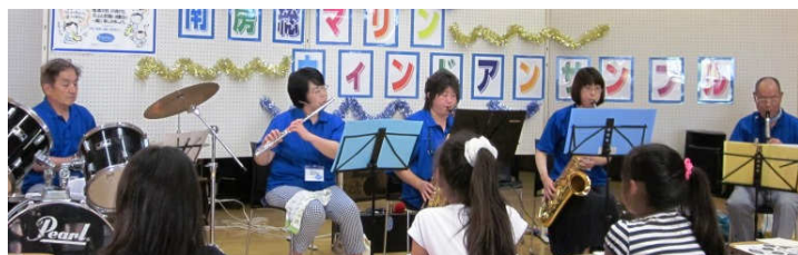
英語教室が終わって、寄ってくれた3人組。聴きたい曲をアンケートにたくさん書いてくれました。次が楽しみですわ♪

全10曲♪最後は今年のアンケートの中から「花は咲く」が演奏され、口ずさんでる方もいましたね。この日はとても気温が高く、日照りの中お越しいただいた皆さん、ありがとうございました。