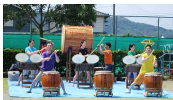
迫力ある演奏、中野太鼓21