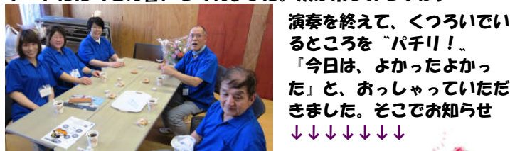
演奏を終えて、くつろいでいるところを「パチリ!」。「今日は、よかったよかった」と、おっしゃっていただきました。そこでお知らせ↓↓↓↓↓↓