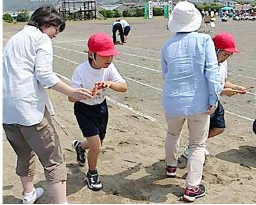
運命走“お手伝い大作戦”(1年生)

発行:地域づくり協議会「みよし」 企画編集:地域づくり支援員(鈴木・横川) 〒294-8701 南房総市谷向100番地(三芳分庁舎内) TEL:0470-36-1185 FAX:0470-36-1133