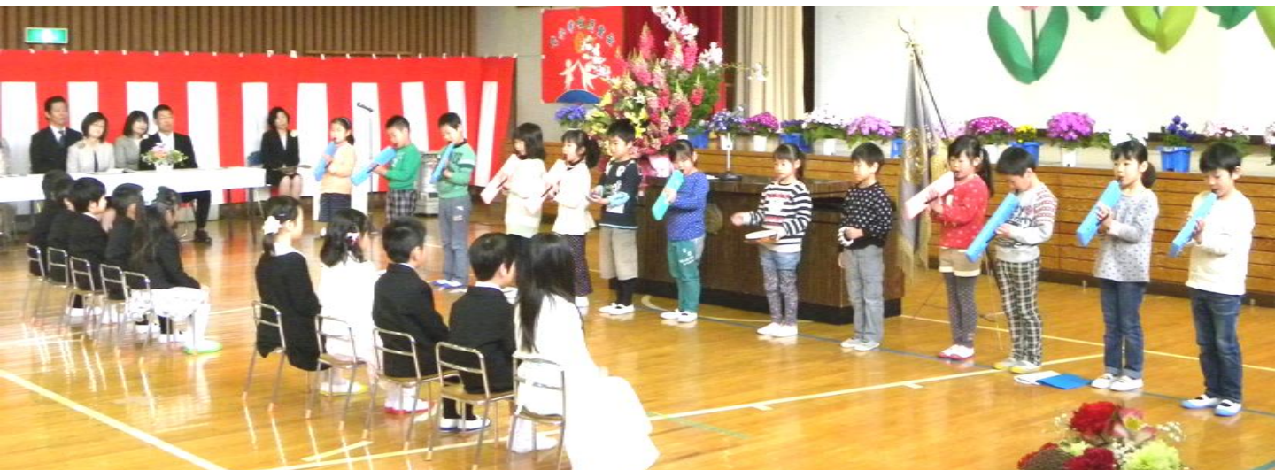
上級生からの歓迎風景