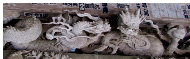
小網寺 中備『子引き龍』