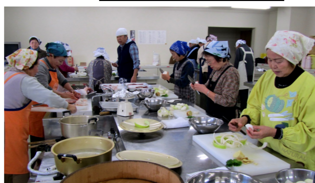
先生を前にコツを聞きながら楽しく調理です