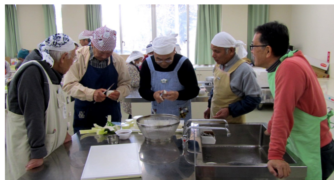
男性陣も器用に、和気あいあいと♪