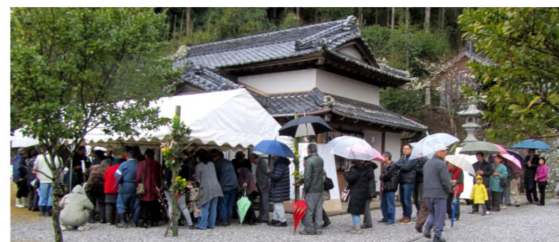
豪華景品の福引きに大行列