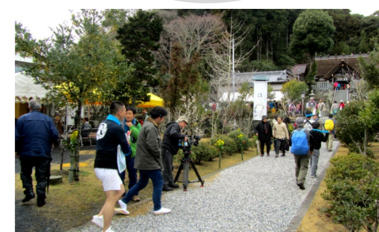
梅に加え、菜の花や椿で房総の春満載でした