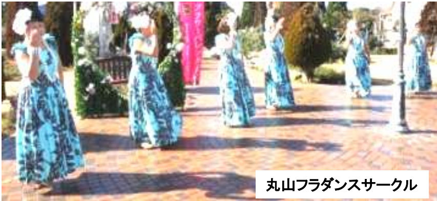
丸山フラダンスサークル