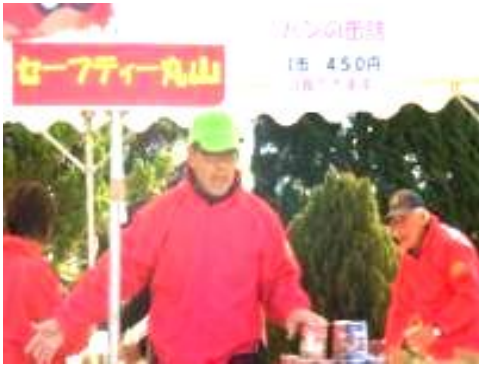
パンの缶詰とハイゼックス袋販売