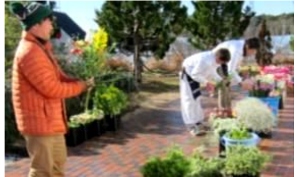
花き部、フラワーアレンジの準備です