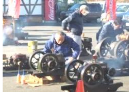
発動機保存会発動機の実演