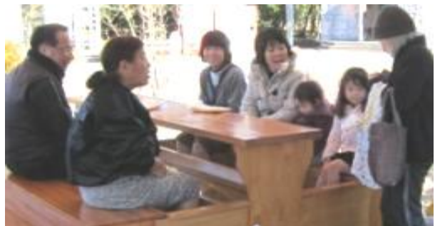
足湯はとてもきもちよかった ♪～

はなまる市場の入り口右側に農業研究会による花のオブジェが展示されていました。テーマは「花萌ゆ」です。約6名のスタッフで5時間位かけて作成したそうです。