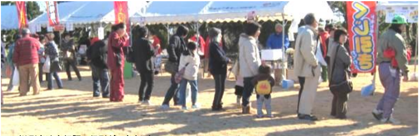
くじ引きは大好評で行列ができました