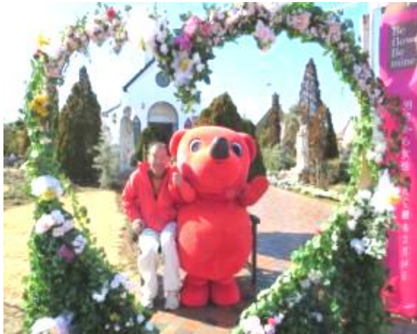
チーバ君も参加してくれました

すてきなフラワーアレンジメント ができました。カラーでお見せ できないのが残念です。