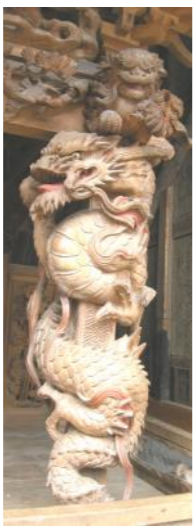
(上：通しなに見事な彫刻の柱)