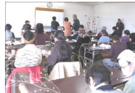
(古きよき行事を楽しむ)

富山地区生涯学習推進員が企画した「小正月の行事を味わおう」が、1月17日、富山公民館で開催されました。