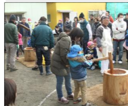
(交替で餅つきをする園児)