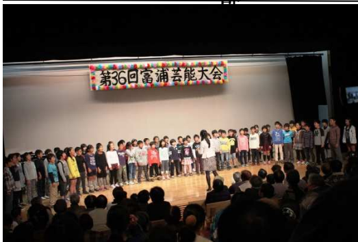
富浦小学校3、4年生による合唱

市文化協会富浦支部主催の芸能大会が先月30日、とみうら元気倶楽部で行われました。