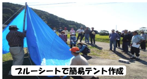
ブルーシートで簡易テント作成