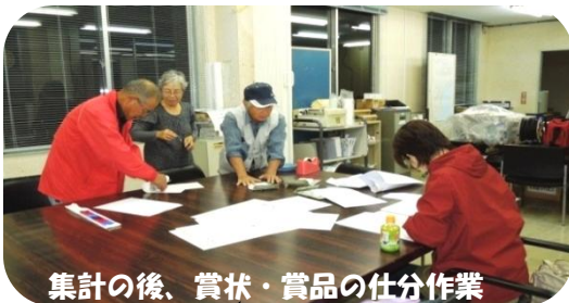
集計の後、賞状・賞品の仕分作業