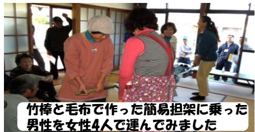
竹棒と毛布で作った簡易担架に乗った男性を女性4人で運んでみました

地域の方より「『自分達で助け合う意識』が出来て良かったです。」という感想がありました。“共助”の体験、訓練が出来て良かったですね。皆さんお疲れ様でした。