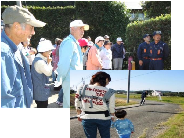
消防第2分団団員による消火栓の説明や放水実演

石神区で10月19日（日）の秋の祭典の午前、災害時に要援護者を避難場所等に誘導する訓練を行いました。石神区は20世帯でこの日は17世帯39人の参加で行われました。