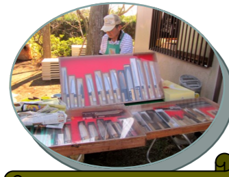
10/17秋季例祭で人気だった包丁研ぎが今回も出店されます