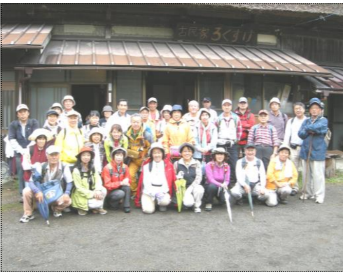
(古民家「ろくすけ」をバックに記念写真)

2年後が楽しみです 7月2日、市部バイパスに植栽した彼岸花は、開花が少なくまばらでした。2年後には球根が大きくなり、隙間なく咲くでしょう。楽しみです。