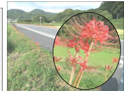
(2年後の彼岸花開花が楽しめる市部バイパス 9/22撮影)

2年後が楽しみです 7月2日、市部バイパスに植栽した彼岸花は、開花が少なくまばらでした。2年後には球根が大きくなり、隙間なく咲くでしょう。楽しみです。