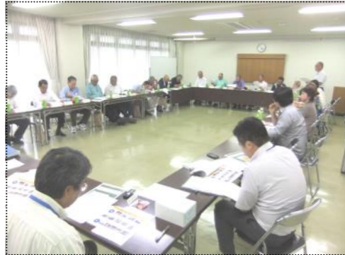
(貴重な意見が交わされた情報交換会)

○区長さんからは、人口が減っていて近所づき合いができなくなってきた。今年も紅梅街道の剪定を、毎年「ふらっと」と一緒にやっています。