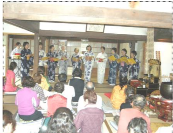
(ベツルルーナの合唱で心休まるひと時)

当日は小雨が時折降る中、平久里下の集合場所から、旧KDDの富山中継所のあった252・3メートルの余蔵山山頂を目指し出発しました。参加者は、杉林の中に秋を感じさせる草花を見ながら頂上広場に到着。あいにくの雨で180度のパノラマの景色は堪能できませんでした。