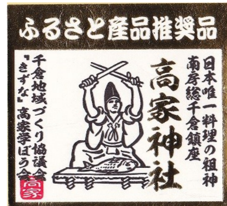
ふるさと産品推奨シール(縁取りは金色) 大：6.0×5.5cm(原寸大) 小：3.5×3.2cm