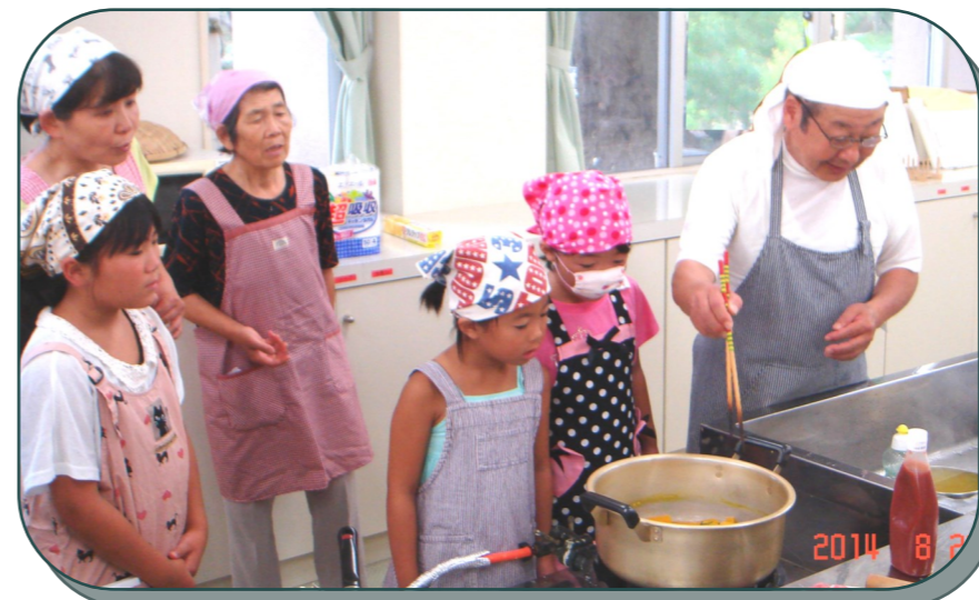
かぼちゃの煮え具合はどうか？