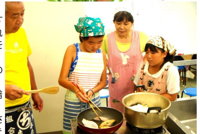
魚を上手に返せました。

『きずなの会』ではお料理を作る事で、子供さん達にも『食』をもっともっと身近に感じていただけたらと願っています。