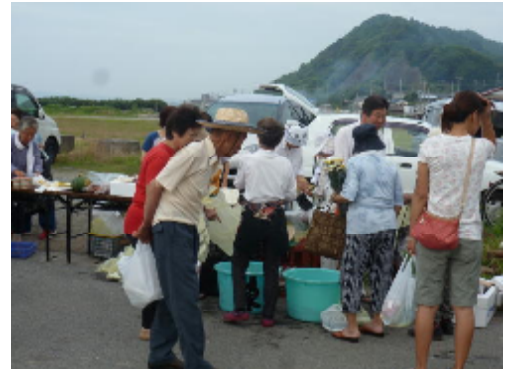
鮮魚もありました

取材した日に出ていたお店は、鮮魚(アジやクジラなど)、野菜(ピーマンやキャベツ、トウモロコシなど)、パン、小物(巾着袋など)、弁当(クジラカツや焼きそば、赤飯など)、花でした。お客さんは「枝豆がこんなに入って200円だよ」「これは、スーパーなら250円はするね。それが