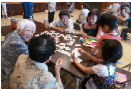
カルタ取りで交流

6月25日に和田地区社会福祉協議会主催の「和田小1・2年生と高齢者ふれあいの会」が行われ、小学生や高齢者など約80名が参加しました。小学生は運動会で踊ったソーラン節や大型の絵本を使って読み聞かせなどを披露しました。それらに対して、お年寄りは手拍子を打ったりうなずきながら聞いたりしていました。さらに、折り紙で鶴ややっこさんを折ったり、竹とんぼやけん玉などの昔の遊びをしたりして、両者は交流を深めていました。