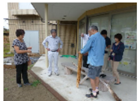
縦杭の長さや太さを検討

この「わだすき60号」が発行されるころに梅雨が明けとしますので、その頃から夕方を中心に、少しずつ作業を始めます。どんな柵ができるか楽しみに。