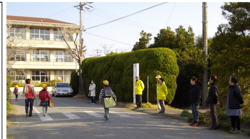
あいさつ運動の様子

毎月第3日曜日に実施している千倉海岸の美化活動（ビーチクリーン活動）を『きずな』は応援しています。