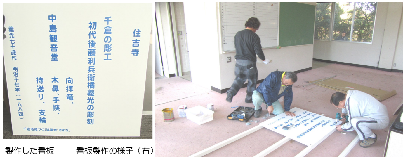
製作した看板 看板製作の様子（右）