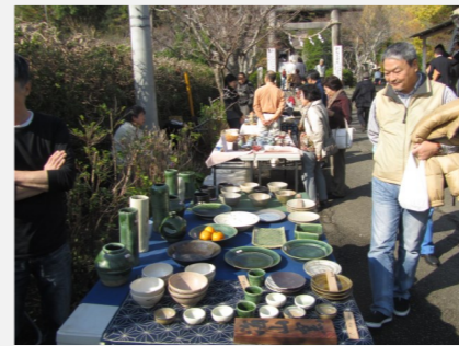
安房の窯元による陶器市