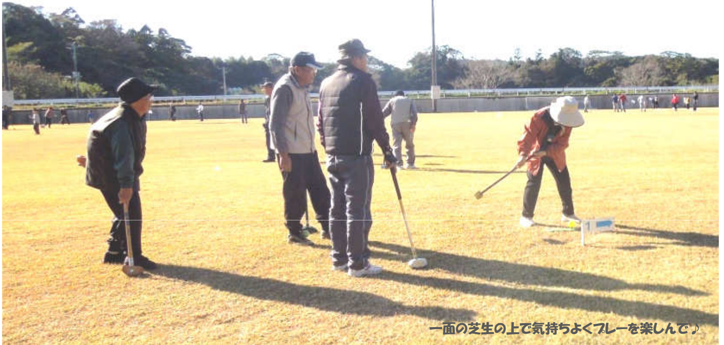
一面の芝生の上で気持ちよくプレーを楽しんで♪

絶好の秋空の下、郷づくりまるやま イベントの会主催による、第3回グラウンドゴルフ大会『丸山オープン』を11月23日（土）勤労感謝の日に、72名の参加により丸山運動広場で開催しました。