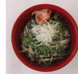
房総沖で獲れた、新鮮なカタクチイワシを使用した漬け丼