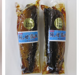
千葉県産の新鮮な鯖を丸々一匹使用。骨まで食べられるほど柔らかく煮込んだ甘露煮