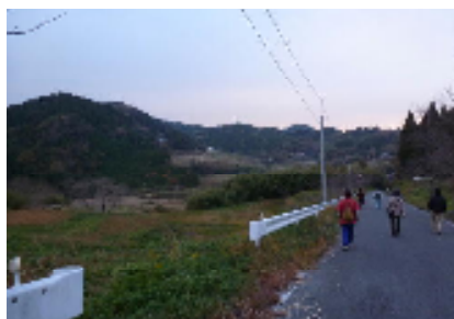
途中に上り下りがあるコース

くすの木(10:00発)→→→磯森(元朝桜見学)→→→小倉家(里見氏ゆかりの家)→→→神渡社(昼食)→→→お大日様(石仏見学)→→→宝性院→→→くすの木(15:00着)