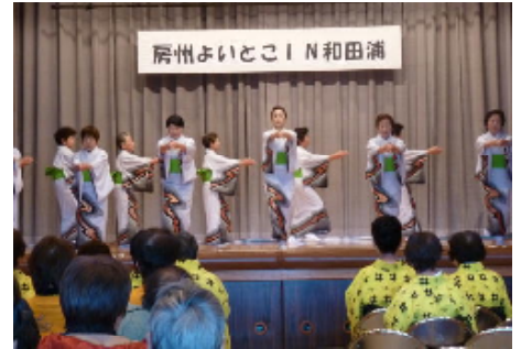
息もぴったりの踊り

11月を「くじら祭り」月間として、クジラに関する作文・絵画展や道の駅「和田浦 WA・O!」オープン1周年感謝イベント、「全国鯨フォーラム 2013 南房総」や「全国勇魚グルメまつり」などの行事が行われてきました。そのしめくくりとして、11月23日（土）に『房州よいとこin和田浦』（日本フォークダンス連盟千葉支部主催）が、コミュニティセンターの市民ホールを中心に行われました。