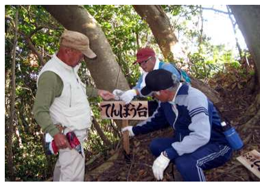
新たに第一展望台の看板設置