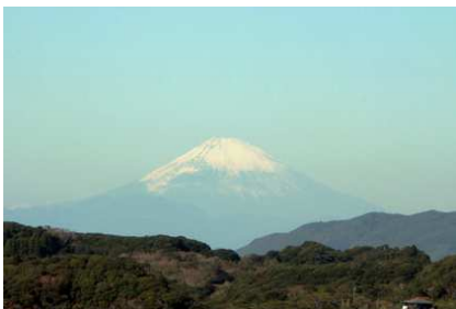
富士見平から見事な姿が見えました