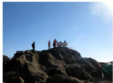
最南端のベンチで記念撮影