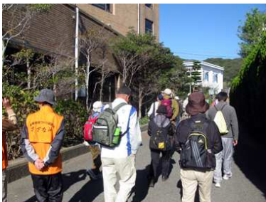
白浜地域センターから出発

富浦の地域づくり協議会「さざなみ」の「ウォーキングコースづくりグループ」のメンバーら11名が、11月21日(木)じょうやまの会の活動状況とウォーキング・コースの視察に白浜を訪れました。9時半過ぎにマイクロバスで白浜地域センターに着いた一行は、簡単なあいさつと準備運動をして9時45分にウォーキングを開始しました。「きらり」からは5人がガイドとして参加し、見所や注意点などをアドバイスしました。青根原神社・芋井戸を見学し青木観音堂から城山の急坂を登り、ニヶ所の展望台と富士見平を経てやぐら口に下りました。そして野島埼灯台西側の芝生広場で、参加者全員が弁当を食べました。同じ海でも富浦と白浜では全く表情が異なるようで、岩に砕ける白波を見つめる「さざなみ」会員の姿が印象的でした。前日まで三日間吹き続けた西風が止んで暑くも寒くもなく、富士山も見える最高のコンディションでウォーキングができて、参加者全員が笑顔で帰途につきました。