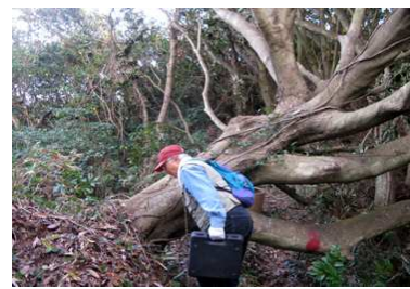
台風で倒れた巨木が道を塞ぐ