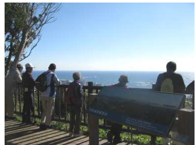
第2展望台から太平洋を眺める