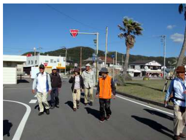
ゴールは近い野島ロータリー