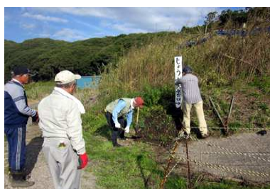
大原台口の看板を立て替え

本格的なウォーキングのシーズンを迎え、新たな看板の設置をしながらコースを点検しました。根元が腐って撤去した大原台口の看板を立て替え、「富士見平」や「第一展望台」「富士講」など地元の書道教室に通う小学生に書いてもらった看板を設置しました。滑りやすい場所にロープを追加設置したり、倒木を取り除いたりしながら、杖珠院の裏まで約3時間かけて歩きました。