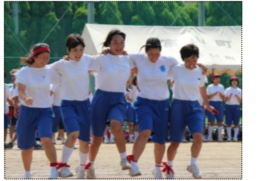
(息を合わせて、確実に一歩ずつ)

秋晴れの9月7日、富山多目的運動場で富山中学校の体育祭が行われました。今年も中学校が工事のため会場を変えて行われ、生徒たちは前日の本番ながらのリハーサル疲れも見せず元気な姿で、全19種目を競い合いました。