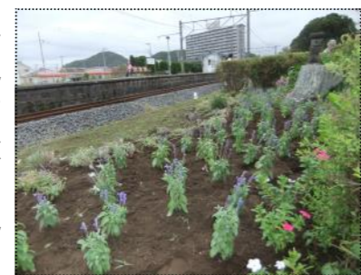
(きれいに植えられたブルーサルビア)

9月24日、いわい案内人の会と一緒に、岩井駅構内花壇の草取りと、日日草やブルーサルビアなどの植栽を行いました。当日は、曇りながらも参加して、1時間あまり気持ちよく汗をかいたようでした。