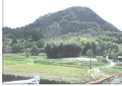
(平群の富士山「神奈備山」の登山道入口)

今月は、平群の富士山「神奈備山」です。平久里中宇南沢に、標高二百メートル程の神奈備(神のおわす山頂のところが「山」の山が見えます。この山を昔から富士山と呼んでいます。山頂の石宮には、「安永八年(1779)五月吉日」とあります。隣の無造作に転がる大石には、「小御嶽(おみたけ) 磐長姫命(いわながひめのみこと)」と彫ってあります。祭神「磐長姫命」は、雨風に強く石のように永久に生命がある神様です。伊予ヶ岳の祭神の「木花開耶姫命(このはなさくやひめのみこと)」はなさくやひめのみこと。この富士山では、昔雨乞いの神事が行われ