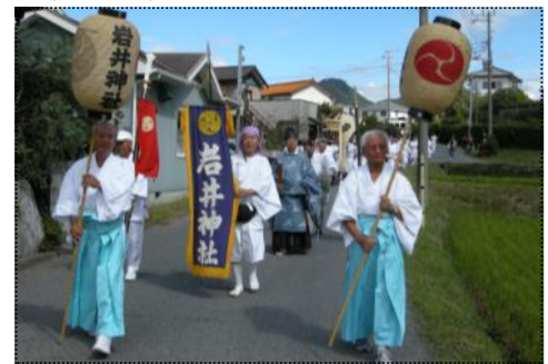
(御旗を先頭に、町内を練り歩く)

高崎区の秋の祭礼(岩井神社の新嘗祭)が、9月28日、今年、伊勢神宮の式年遷宮のため行われるもので、子や区の役員によって五穀豊穰の神事の後に、神輿の渡御が行われました。神輿の担ぎ手は、御旗の後を伊勢節の調子に合わせてゆつくりと地域内を練り歩き、秋の収穫を祝っているようでした。