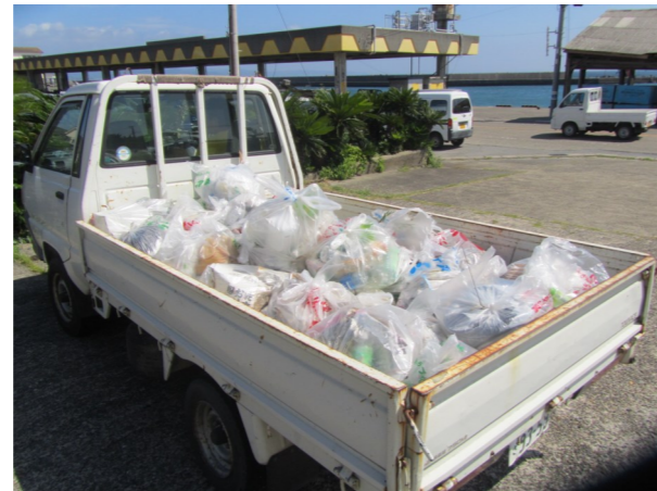
集まった ゴミの一部