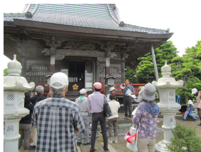
(写真は6月に行われた作品見学会の様子)