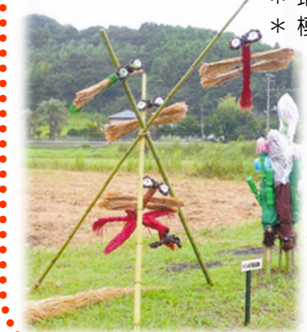
案山子コンテスト 昨年の大賞作品 「トンボ飛行隊」

内容 * オリジナル案山子コンテスト * 地元産品の直売 * 模擬売店 など、 いろいろ 盛りだくさん!!