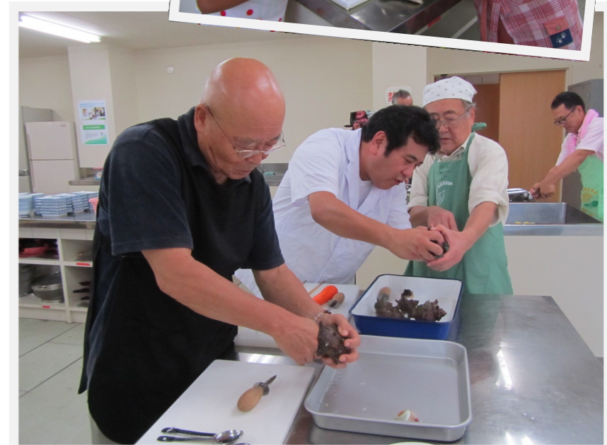
サザエを貝から取り外しているところ