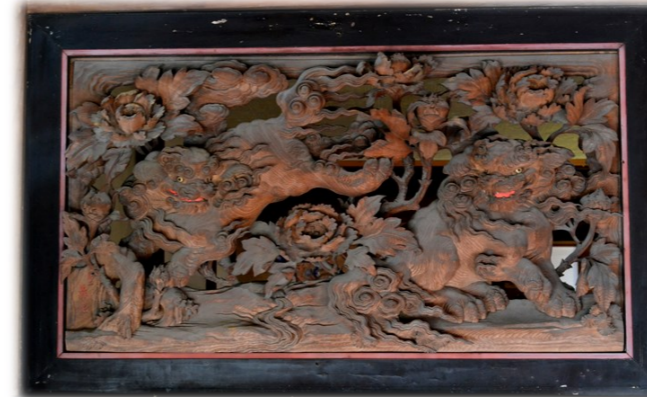
本堂欄間(牡丹に唐獅子)