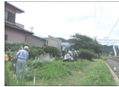
(作業前は、雑草がうっそうと)

岩井駅を利用する人に、気持ちよく利用していただくよう、毎月「ふらっと」では、毎月「ふらっと」と一緒に駅構内の清掃活動を行っています。6月27日は、花壇にさくらさくら