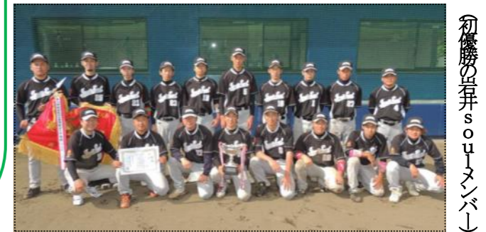
初優勝の岩井SOULメンバー

第13回南房総地区春季野球大会(南房総市・鋸南町野球連盟主催)の準決勝、決戦が、6月2日、千倉総合運動公園野球場で行われ、岩井SOULが悲願の初優勝を飾りました。 この大会は南房総市・鋸南町の18チームが参加し、2ヶ月間にわたり優勝を争ってきたもので、岩井SOULはスプリーズを準決勝で、