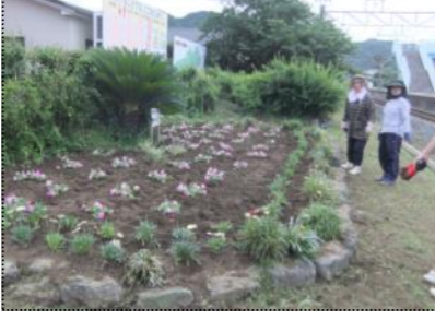
(1時間半ほどの作業できれいに)