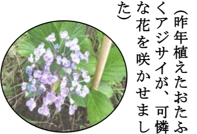
(昨年植えたおたふくアジサイが、可憐な花を咲かせました)