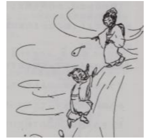
(落ちた枇杷を拾おうと二人とも海へ)

枇杷の産地として知られていて、次のような話が伝えられています。 ある夏の暑い日、小浦の近くを館山へ向かう老人と若い娘が歩いているとき、おじいさんが「海は目が不自由なようではいへ、二人の旅人はかなり疲れているようです。そばを通りかかった一人のおばあさんが、手に持っていた枇杷を出して、「のどがかわいたことだっぺ。これ、どうぞ。」と娘の遠慮がちに手の中に入れてや