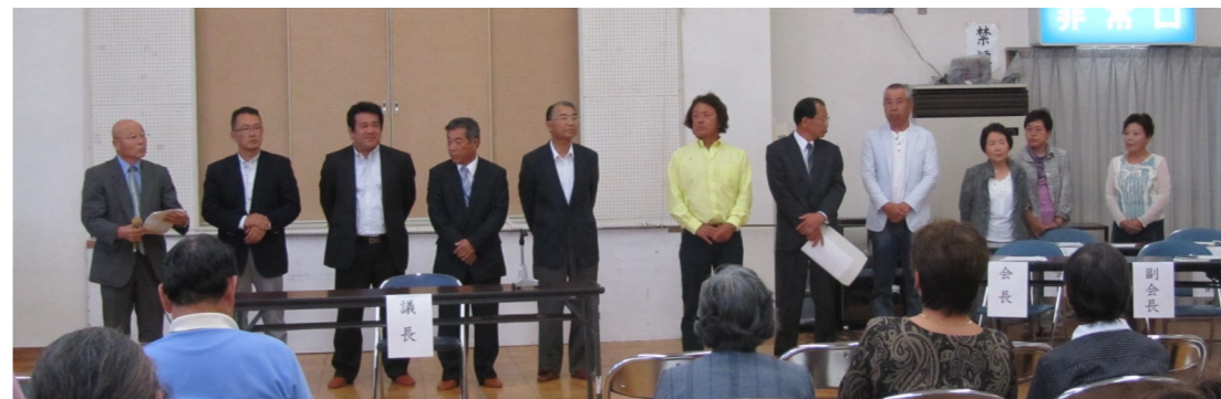
役員改選で選出された運営委員