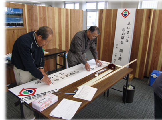
カットしたアクリル板に、標語の文字を貼っていきます

千倉地域づくり協議会『きずな』のきずなの会部会では、昨年9月に公募した「あいさつ」についての標語の看板（入選作品9点）を製作。会員達でアクリル板のカットからカッティングシートの作成、看板の設置まで行いました。完成した看板は、町内の学校・公共機関等以下の場所に設置しました。