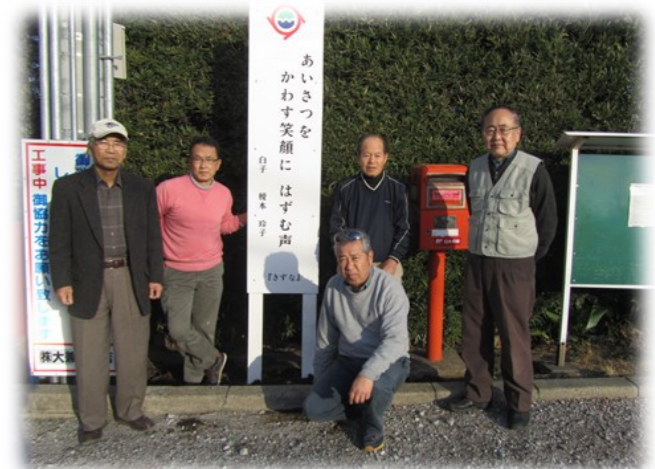
朝夷行政センターに設置した看板