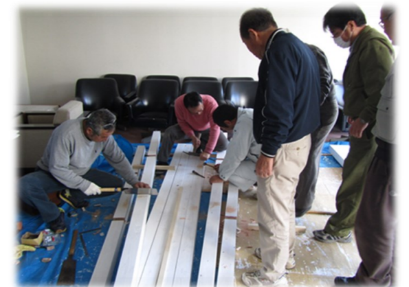
支柱にペンキを塗り、ノコギリやノミで切り込みを入れてきます