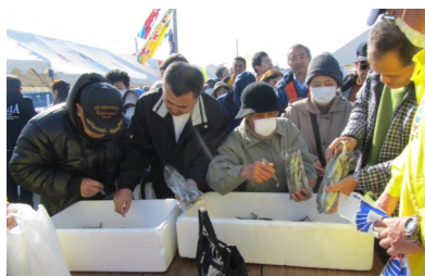
長い行列ができた「ししゃもの詰め放題」

次回は更に盛り上がりのあるもっとパワーアップした物産市が開催できるよう検討していきたいと思ひます。