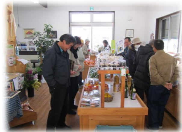
直売所視察の様子

毎月第3日曜日に実施している千倉海岸の美化活動（ビーチクリーン活動）を『きすな』は応援しています。