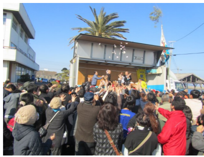
もち投げにも多くの方が集まりました