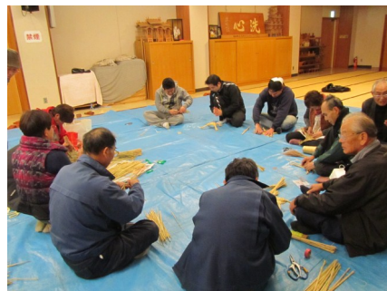
亀づくり教室のようす