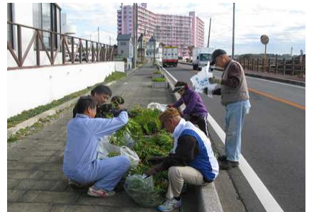
はみ出した植物の刈り取り

← 旧長尾小入り口の花壇は、夏の水遣りが功を奏したのか、最近までマリーゴールドなどが、きれいに咲いていました。それらを全部抜き取って、キンセンカを同心円状に3列並べて植えました。ここは土のボリュームもたっぷりあるので美しい花を咲かせてくれるでしょう。