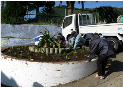
旧長尾小入り口の大型花壇

11月20日(火)は前週やり残した西側(横渚～砂取)地域のプランター・花壇にキンセンカの定植を行いました。また27日(火)には全部のプランターを巡回して補植と、フローラルホール近くの海岸通りで伸びすぎた多肉植物を刈り込みました。