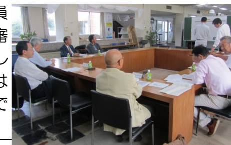
審査のようす どれも素晴らしい標語で審査員の方々も選ぶのが大変だったようです。

6作品、一般の部40作品、合計689作品の応募があり、あいさつ運動を中心に行っている「きずなの会」で事前に候補を絞り込み、市長、教育長、協議会長、きずなの会役員で厳密に審査しました。結果は次の通りです。