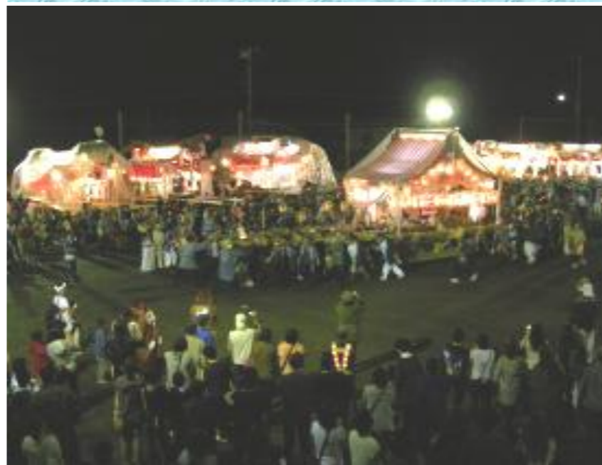
(屋台が、次々に入退場する姿は勇壮です。昨年の祭礼から)

平群地区の祭礼が10月20日(土)に行われます。今年も、平群各地区から明かりの灯った担ぎ屋台8台が平群グラウンドに集合し、屋台のイルミネーションと平群ばやし、屋台の演奏を繰り広げます。屋台の集合時間は、午後6時から8時ごろまでです。また神輿の渡御は、例年通り天神社を出発してお仮舎まで行われ、花火の打上げは、屋台がグラウンドに入場の際にタモツデンキ付近と、午後8時過ぎにお仮舎付近で打ち上げられます。お祭りを楽しみ、地域の交流を深めましょう。