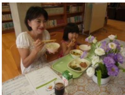
(親子で楽しい給食を)

「日本一の「ご飯給食」を 目指す給食をぜひ味わって」 『給食レストラン』参加者募集