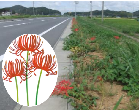
(今年の区間は開花が少なかったですが、大きい花を咲かせました)

人たちが一緒になって行っていきます。数年後には市部バイパス両側が、彼岸花でいっぱいになることでしょう。