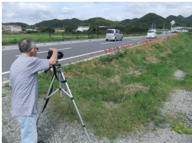
(昨年植栽した区間は、撮影スポットに。9/27撮影)

県道外野勝山線(通称市部バイパス)の東側約800メートルの道路沿いに、彼岸花が真っ赤な花を咲かせました。これは、白鳩保育園児と地域のみなさんで、昨年と今年の7月に植えたもので、昨年は彼岸の中日から約5日ほど遅れで咲きましたが、今年は約束通りに彼岸に咲き、10日ほど市部バイパスを彩りました。昨年に植えた区間は球根が大きくなって株も増え、りっぱな花を咲かせアマチュアカメラマンの撮影スポットになっていました。今年植えた区間は花と花の隙間が多く、所どころに群生していました。来年が楽しみです。