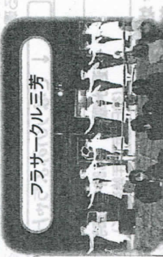
フラサークル三芳