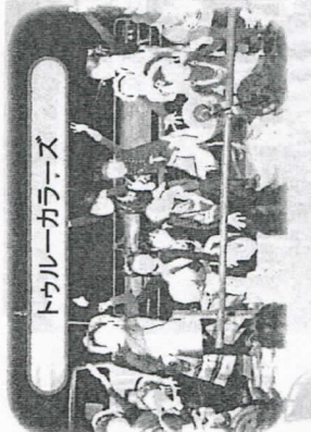
トータルカラーズ