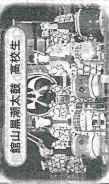
館山黒潮太鼓 高校生