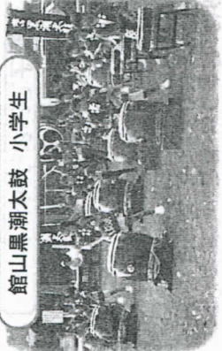
館山黒潮太鼓 小学生