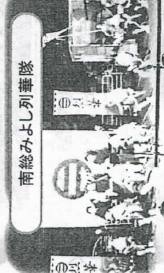
南総みよし列華隊