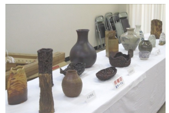
土師部の館と各サークルごとの作品