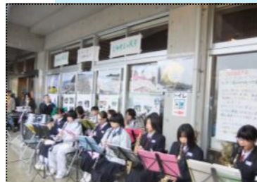
(富楽里水仙まつりでのミニコンサート)