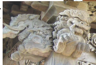
中嶋観音堂向拝竜・木鼻 初代70歳作